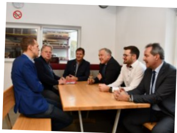
Im Gespräch mit Wirtschaftsvertretern unserer Gemeinde.