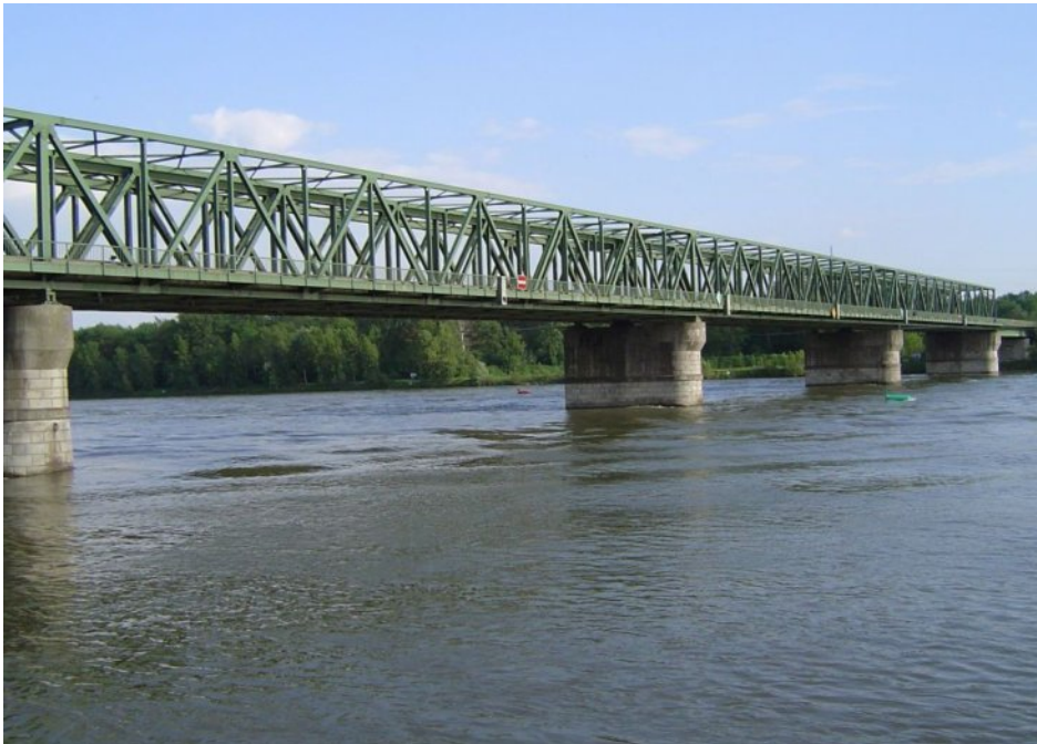
Die Donaubrücke verbindet Mauthausen und Pyburg

Ende Mai 2019 präsentierten die Planer der NÖ Straßenabteilung den Gemeinderäten von St. Pantaleon-Erla und St. Valentin mögliche Trassenführungen von der geplanten neuen Donaubrücke Richtung Rems St. Valentin.