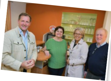
Das Thema Nahversorger lag uns in den Gesprächen sehr am Herzen.

Wir nutzten die Möglichkeit nicht nur unseren Ort vorzustellen, sondern v.a. aufzuzeigen, wo wir in Zukunft Unterstützung des Landes NÖ brauchen werden.