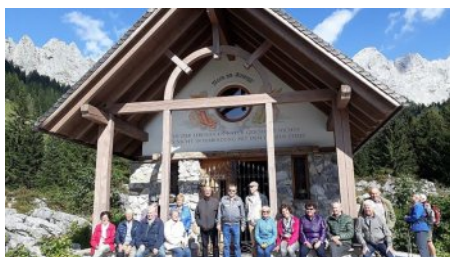
Seniorenbund - Ausflug Filzmoos