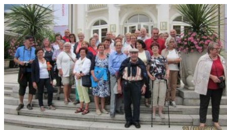
Seniorenbund - Ausflug Südtirol und Gardasee