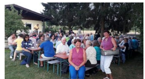
Seniorenbund Grillfest & Plattl schießen